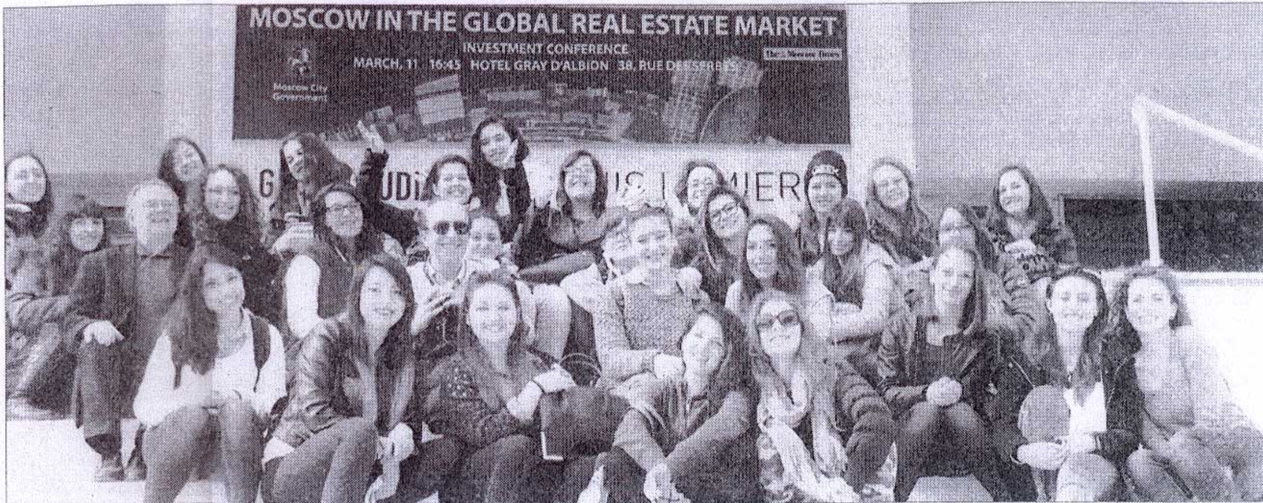
Gli studenti lagonegresi

Il gruppo dei partecipanti, composto da 29 studenti, 14 iscritti alla prima classe e 15 alla terza, ha