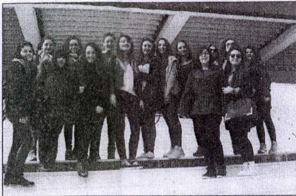
Alcune immagini degli studenti durante il loro soggiorno francese